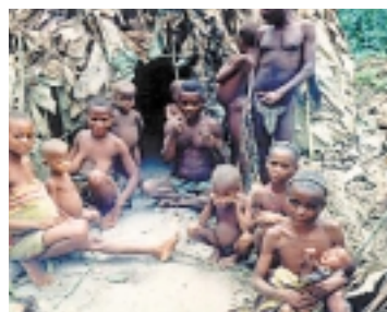
Una familia de pigmeos

En el norte de Nigeria habitan los fulani, que se dedican a la cría y pastoreo de ganado