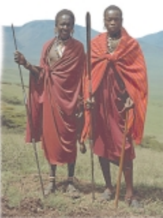
Guerreros de la tribu masai que viven en Tanzania

Los pueblos que predominan son de raza negra, mientras que los blancos, de origen camita, se encuentran en partes de Somalia y Etiopía, país que acoge el núcleo más importante del cristianismo. Las lenguas bantúes más conocidas y habladas se emplean en Tanzania (swahili y sukuma), Kenia (kikuyu), Uganda (ganda), Ruanda (ruandés) y Burundi (rundi). Además, entre las sociedades ganaderas destaca la presencia de los masai en Kenia y Tanzania.